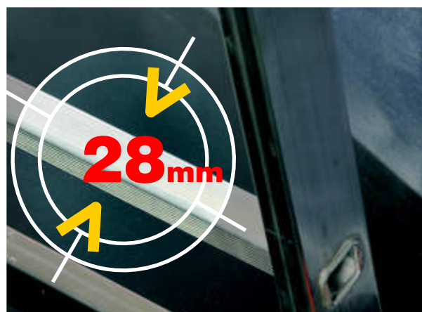
Piolo 28x28 in alluminio estruso antisdrucchiolo con angoli arrotondati rungs 28x28 mm in anti-slip extruded aluminium with rounded corners

ORANGE is a 2 and 3 elements ladders range. For professional use, practical and easy to use , renewed in detail: steel hinge, rung 28x28 mm guaranteed minimum area and antiopening strong belts . Pitch of rungs 280 mm.