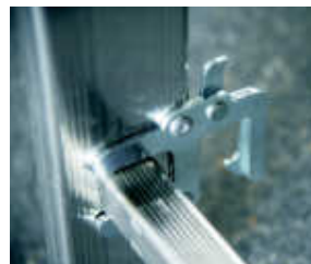
Dispositivo di blocco tronchi (antisfilo) Element blocking device (anti-loosening)