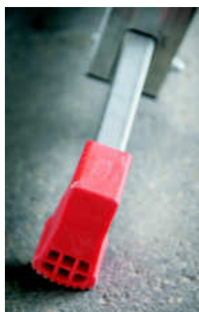
Base con tacco in pvc antiscivolo mescola morbida Stabilizer base with not-slip soft compound PVC feet