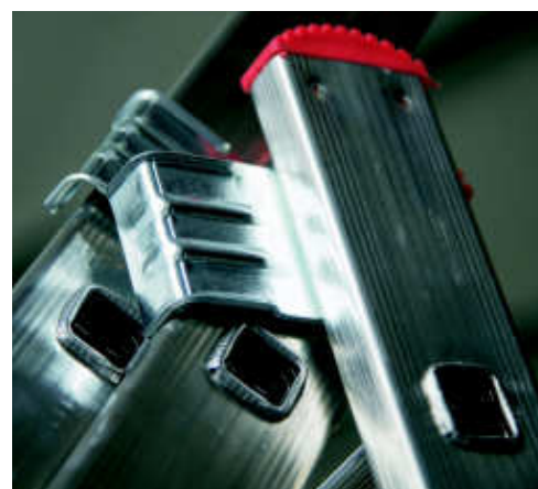
Cerniera in acciaio (in caso di urto non si rompe) con agevolatore di apertura Steel hinge (in case of impact does not break) with opening facilitator