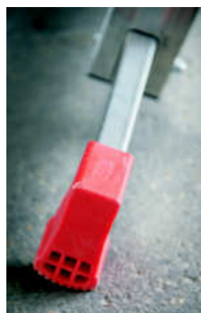
Base con tacco in pvc antiscivolo miscela morbida Stabilizer base with not-slip soft compound PVC feet