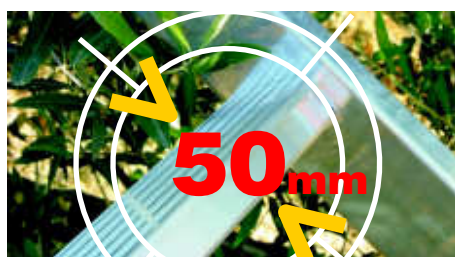
Piolo comfort mm 50 in alluminio estruso antisdrucchiolo Extruded aluminum not-slip comfort rung 50mm