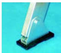
Optional: Piedino snodato con base in gomma e struttura acciaio Adjustable feet with rubber base and steel structure