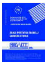
Libretto di uso e manutenzione obbligatorio per UNI EN 131, con certificazione inclusa Mandatory UNI EN 131 use and maintenance handbook , with certification included