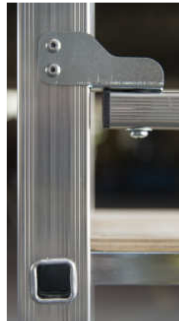
Particolari in acciaio zincato, anti rottura Unbreakable galvanized steel details