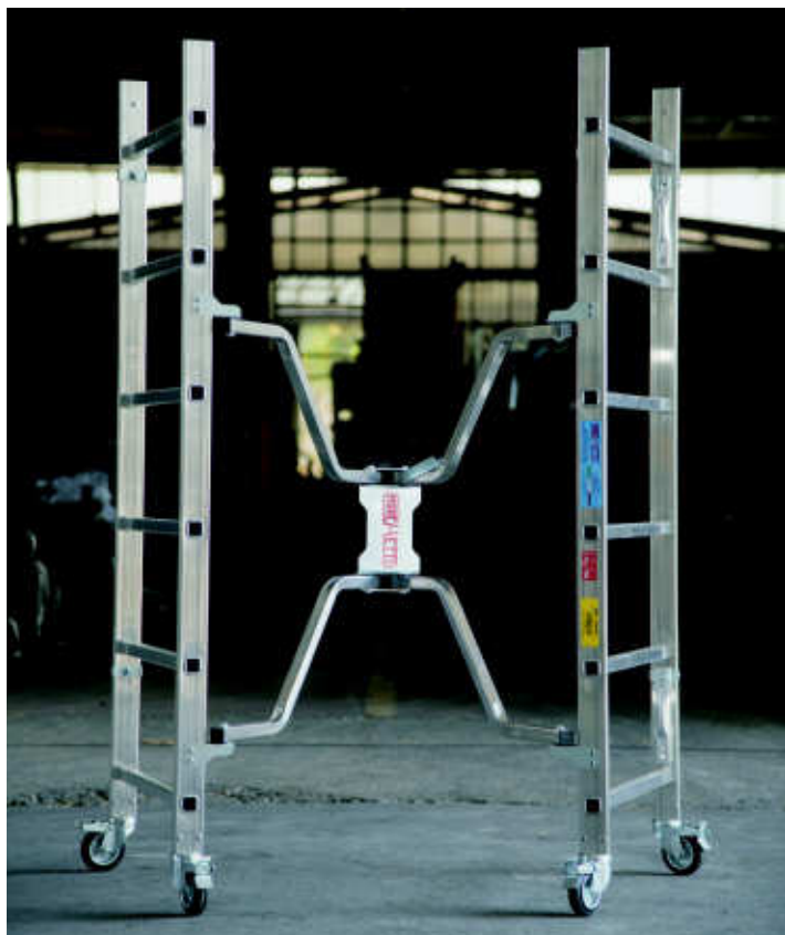
Si apre e si chiude con un click Open & close with a click

Dinamico can be fitted quickly, without the use of screws or tools , foldable without disassembly, thanks to the special joint , occupies only 25 cm of space . Double platform possibility of shifted position to facilitate the climb . Assembled with top tower, can reach a work area of 4 m . Packaging in shrink wrap.