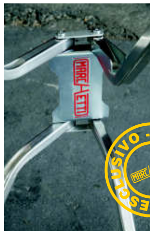
Elemento di chiusura rapida con blocco di sicurezza Quick closing element with safety lock