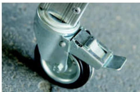
N. 4 ruote mm Ø 100 con freno N. 4 wheels with brake mm Ø 100