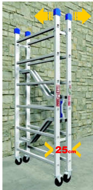
Chiuso occupa solo cm 25 Folded it's only 25 cm